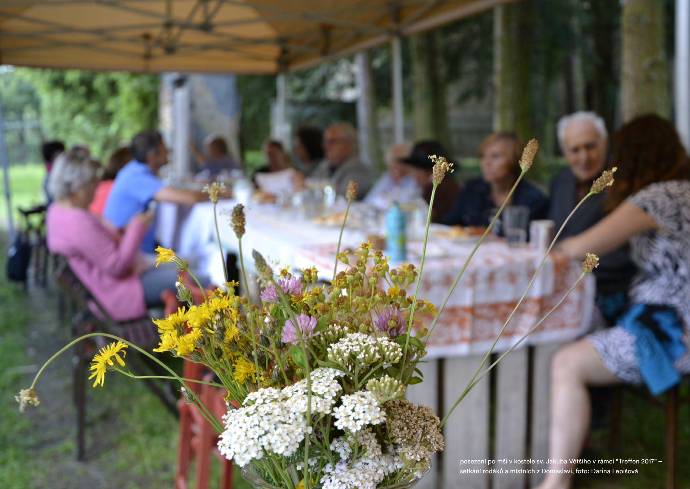
posezení po mši v kostele sv. Jakuba Většího v rámci "Treffen 2017" – setkání rodáků a místních z Domaslavi, foto: Darina Lepišová