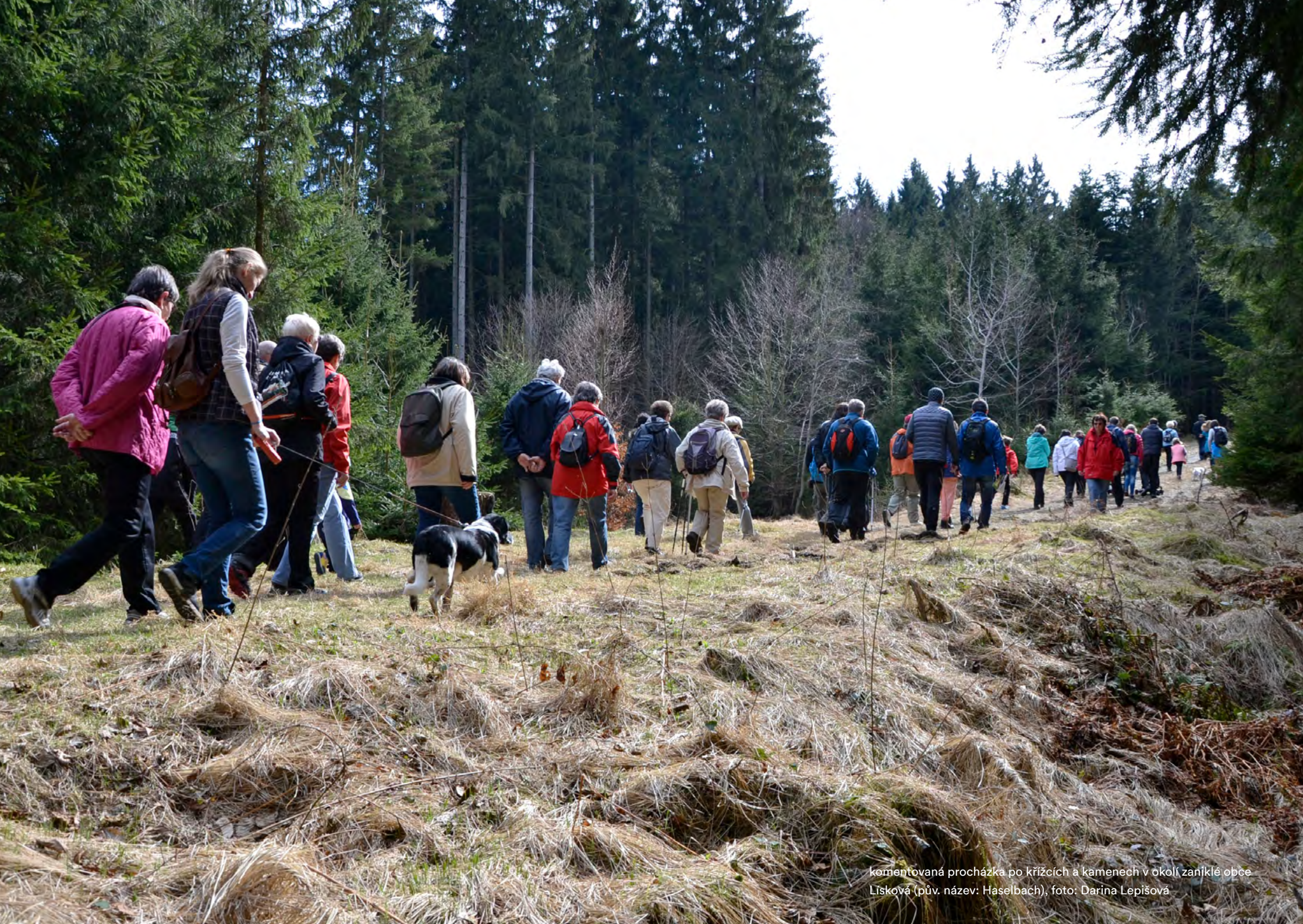
komentovaná procházka po křížcích a kamenech v okolí zaniklé obce Lísková (pův. název: Haselbach), foto: Darina Lepišová