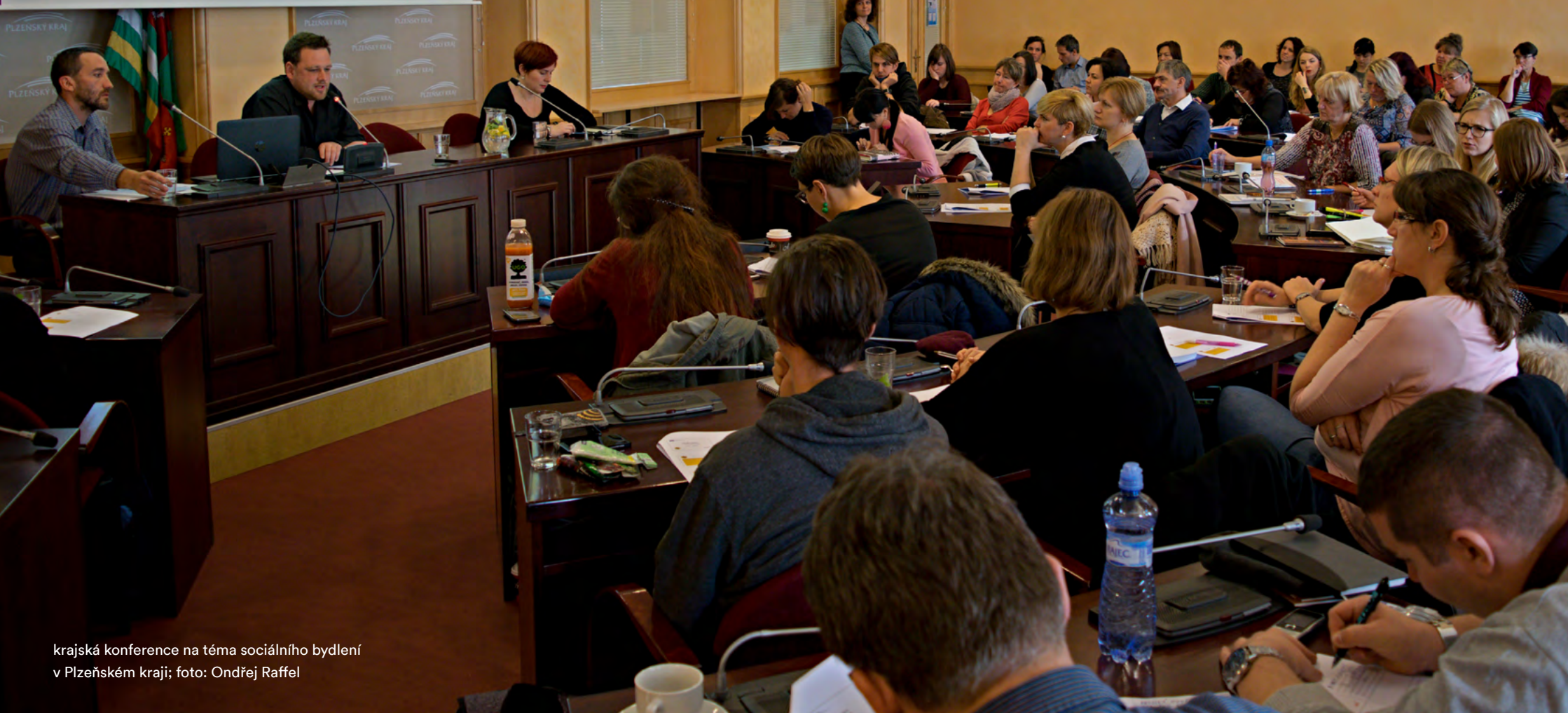
krajská konference na téma sociálního bydlení v Plzeňském kraji